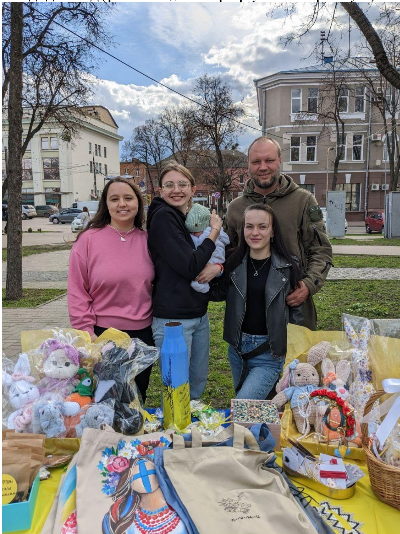
ДОДАТОК Д (фото з благодійного ярмарку 05.04.2025 р. м. Суми)