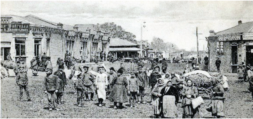
Конотоп. Базарна площа