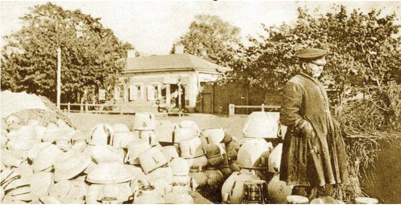
Полтава. Ярмарок на Сінній