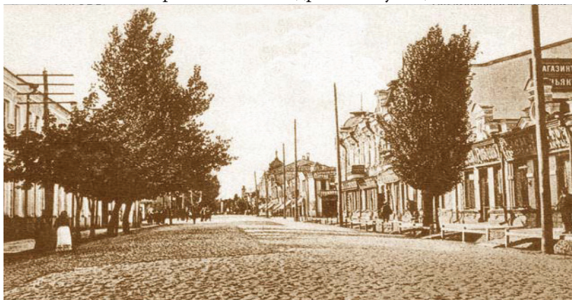
Полтава. Петровська вулиця