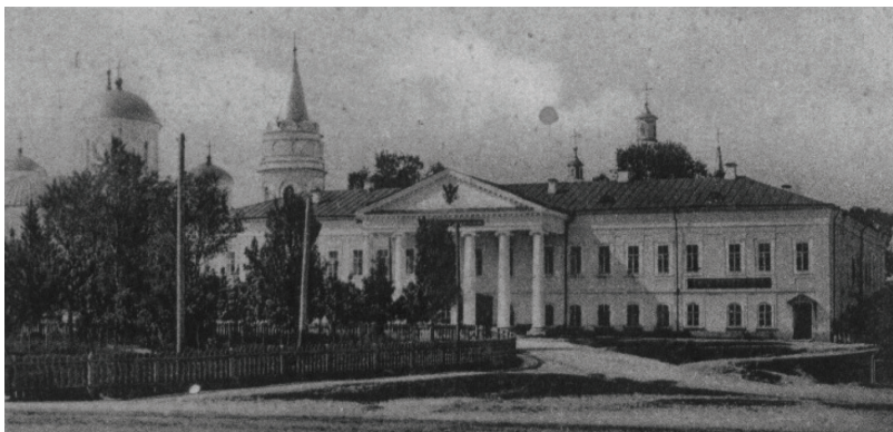
Чернігів. Приміщення Губернського правління