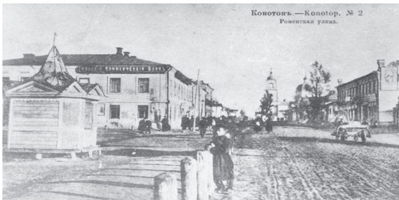
Конотоп. Вулиця Роменська