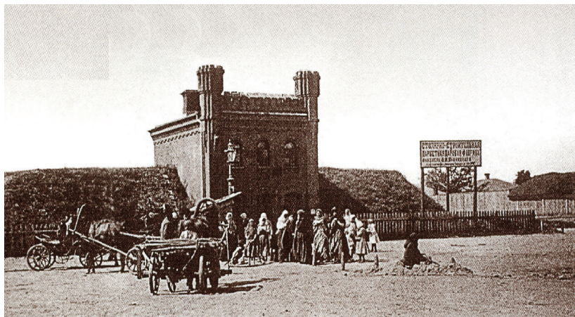
Харків. Холодна гора. Водонапірний басейн у 1891р.