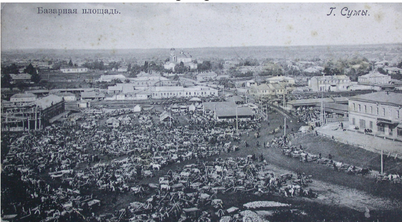
Суми. Базарна площа