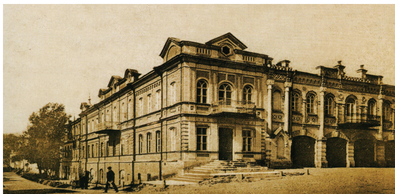
Суми. Приміщення міської управи