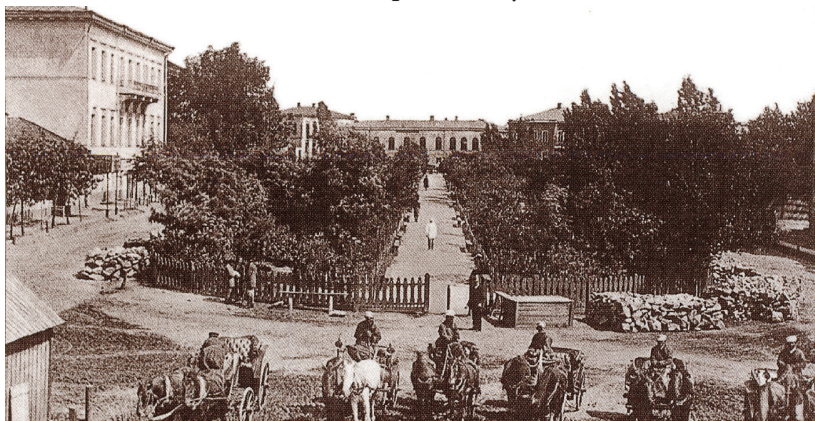
Харків. Театральний сквер, 80-ті роки 19 століття