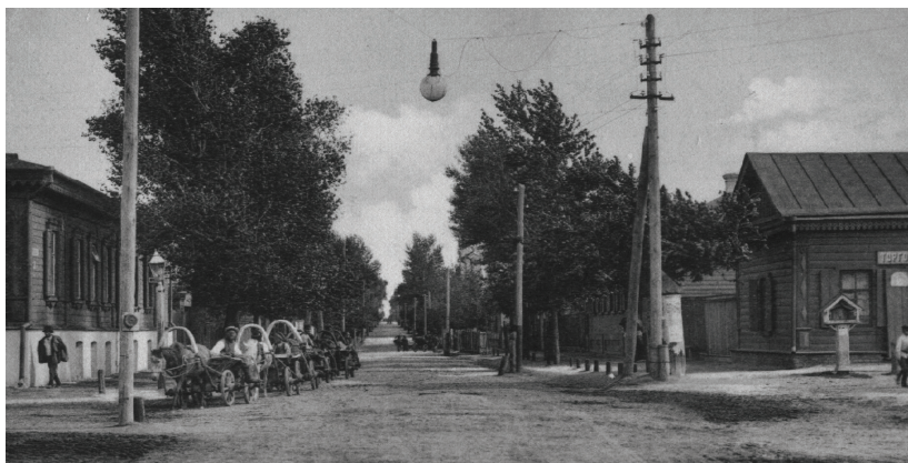
Чернігів. Олександрівська вулиця