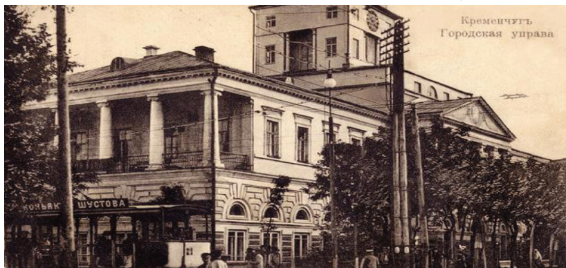
Кременчук. Приміщення міської управи