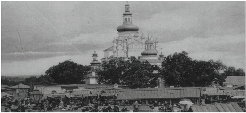
Чернігів. Приміщення Губернського правління