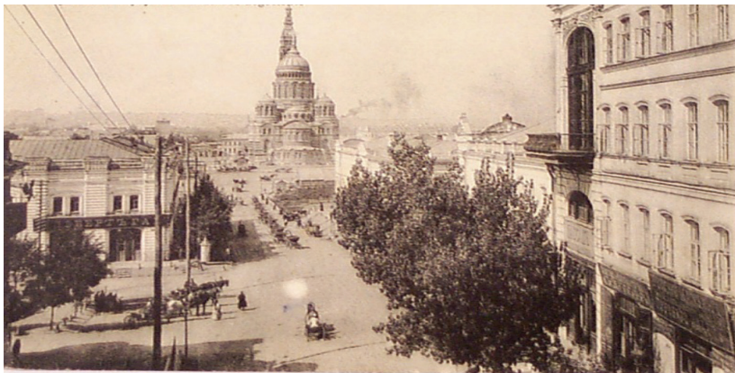
Харків. Купецький провулок