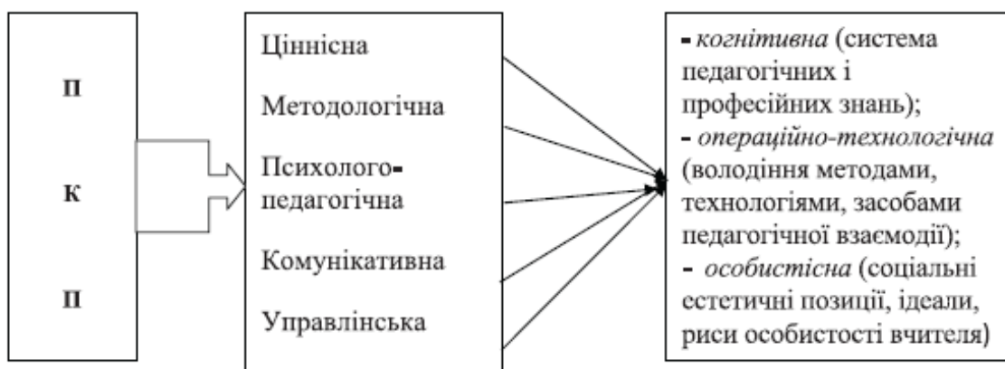
Рис. 1. Структура професійної компетентності педагога (за М. Войцехівським)

С. Толочко, працюючи над дослідженням питання модернізації компетентнісного підходу, проаналізувала структуру і моделі професійної компетентності педагога. Так, аналізуючи міркування М. Войцехівського [3], вона надає запропоновану вченим структуру професійної компетентності педагога (ПКП), до складу якої входять наступні складові: ціннісна, методологічна, психолого-педагогічна, комунікативна, управлінська, кожна з яких характеризується трьома компонентами (когнітивна, операційно-технологічна, особистісна) [14, с. 33] (рис. 1):