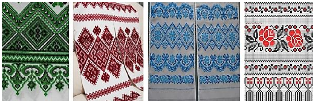
Рис.8. Використання вправи ФО «Кольоровий код»

комунікації, аналізу художніх образів, інтерпретації мистецьких творів і усвідомлення особливостей українського народного мистецтва (рис.8) [5, с.224].