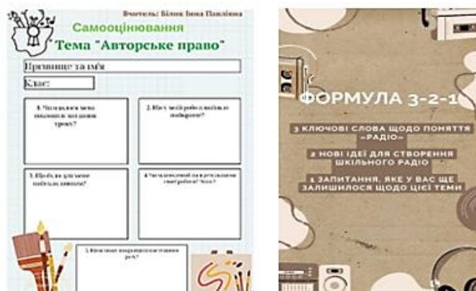
Рис.7. Застосування інструментів самооцінювання

Ефективним інструментом самооцінювання є «Формула 3–2–1», яка допомагає учням осмислити отримані знання, визначити нові ідеї та сформулювати власні запитання (рис.7) [5, с. 265].