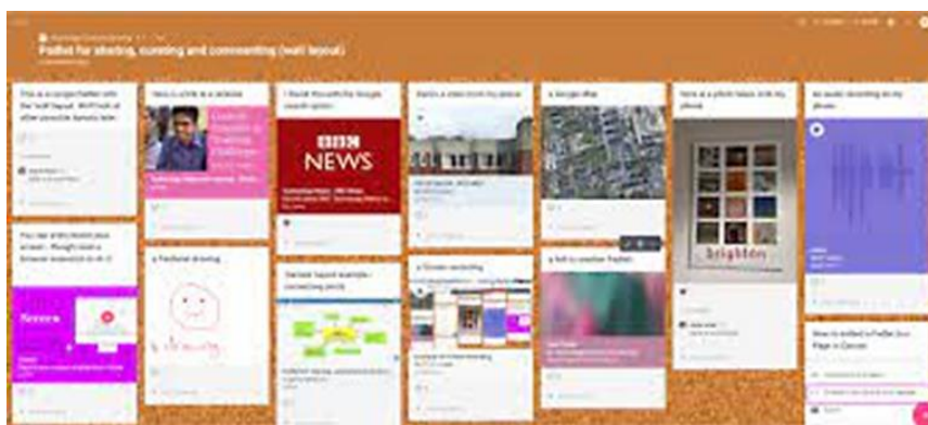
Рис. 1. Перевірка домашнього завдання на дошці Padlet

Для організації взаємодії учасників освітнього процесу та створення спільнот професійного обміну досвідом доцільно використовувати спільну дошку Padlet. Наприклад, учні можуть розміщувати відео романсів чи серенад, які їх зацікавили, здійснюючи музичне вітання та водночас розвиваючи навички цифрової комунікації (рис.1) [5, с.141].