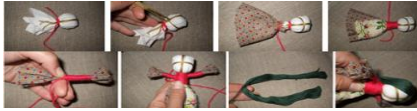
Рис.14. Проведення майстер-класів

Для аналізу активності та ефективності навчальної діяльності доцільно використовувати техніку формувального оцінювання «Статуя», що дозволяє візуалізувати рівень розуміння матеріалу та зацікавленості учнів. Шкала оцінювання може бути представлена певними позначками у просторі приміщення, наприклад, зробити хрест, розділивши середовище на 4 квадрати, де: одна вісь – розуміння матеріалу (перехід від «я все розумію» до «я нічого не розумію»), а друга вісь – інтерес до теми (перехід від «тема нудна» до «тема захоплива») [4, с.87].