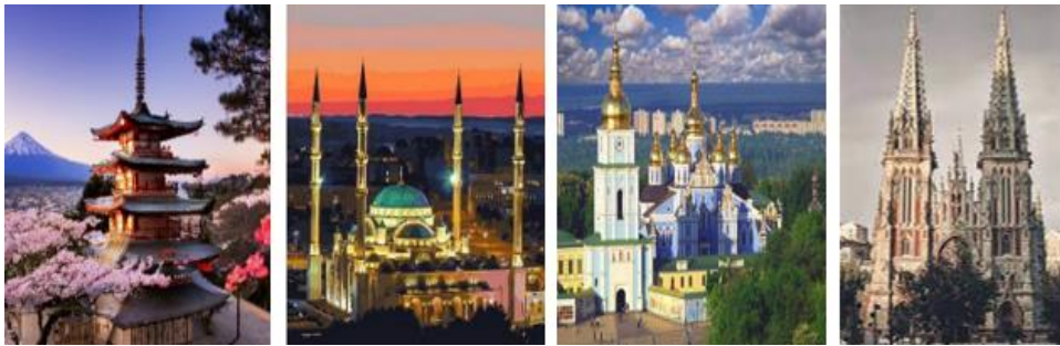
Рис. 5. Застосування інструменту ФО «Встановити відповідність»

Розвиток умінь добирати цифрові освітні ресурси забезпечують інтерактивні вправи LearningApps, зокрема «Види декоративно-прикладного мистецтва» та «Знайди пару» (рис. 6), що активізують пізнавальну діяльність учнів і підтримують їхню навчальну мотивацію [5, с. 224].