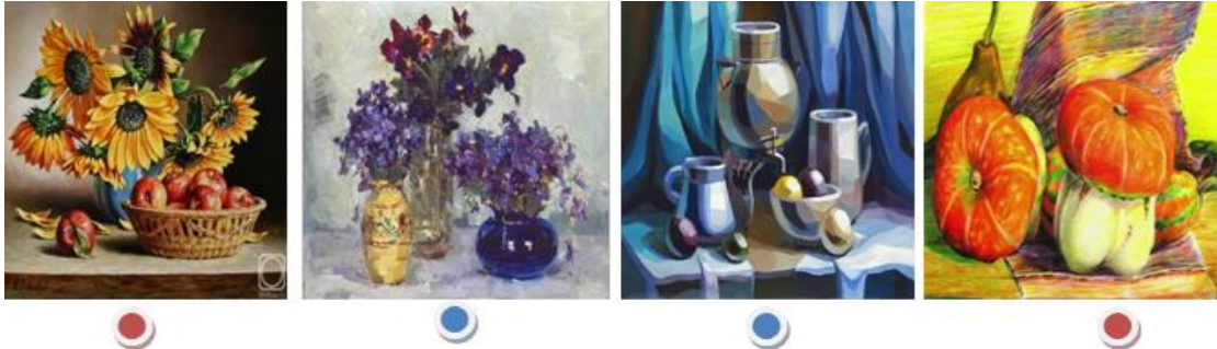
Рис. 3. Використання інструменту ФО «Порівняй»

Мистецька грамотність учнів успішно формується під час виконання вправи «Порівняй», у якій необхідно розподілити натюрморти за теплою та холодною кольоровою гамою (рис.3) [4, с. 31].