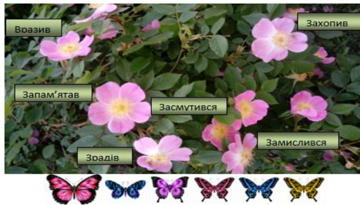
Рис. 12. Використання вправи ФО «Квіткова галявина»

Узагальнюючу рефлексію доцільно проводити за допомогою прийому «Рефлексія ВАК», який активізує сенсорне сприйняття та сприяє усвідомленню отриманого досвіду (рис. 13). Учитель ставить три запитання: