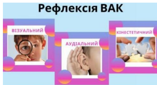
Рис. 13. Використання вправи ФО «Рефлексія ВАК»

Чого ви навчилися на уроці, використовуючи тіло? [5, с. 151]