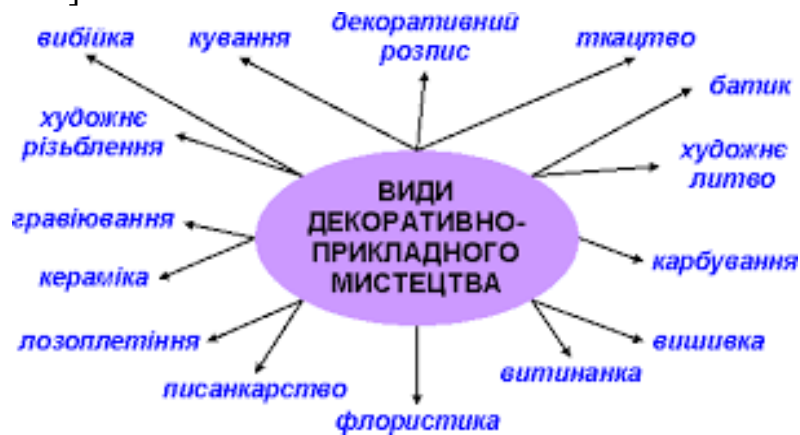
Рис. 9. Використання вправи ФО «Асоціативний куш»

Позитивні результати дає також створення асоціативного куша «Види декоративно-ужиткового мистецтва», що сприяє розвитку співпраці та взаємопідтримки між учасниками освітнього процесу (рис. 9) [5, с. 214].