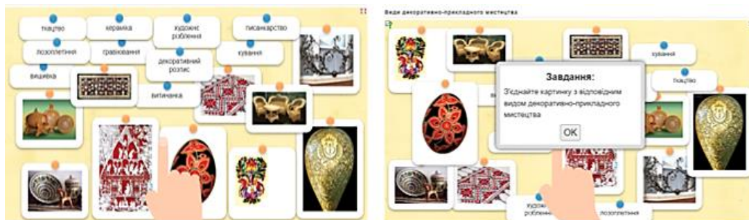
Рис.6. Використання вправ з LearningApps

Розвиток умінь добирати цифрові освітні ресурси забезпечують інтерактивні вправи LearningApps, зокрема «Види декоративно-прикладного мистецтва» та «Знайди пару» (рис. 6), що активізують пізнавальну діяльність учнів і підтримують їхню навчальну мотивацію [5, с. 224].