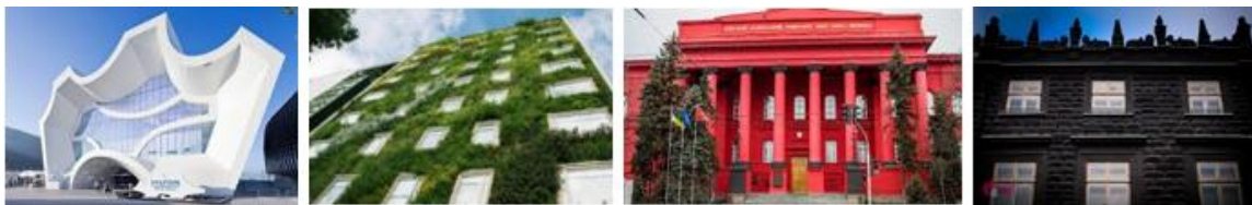
Я спокійний Я задоволений своєю працею Мені було складно Я засмучений |

Особливу роль у мистецькій освіті відіграє розвиток емоційного інтелекту. Саме тому доцільним є використання вправ «Галлявина настрою» (учні обирають квітку, яка відповідає їх емоційному стану і кріплять її на магнітний фліпчарт) або рефлексії через вибір архітектурної споруди, що відповідає емоційному стану учня (рис.4) [5, с. 232].