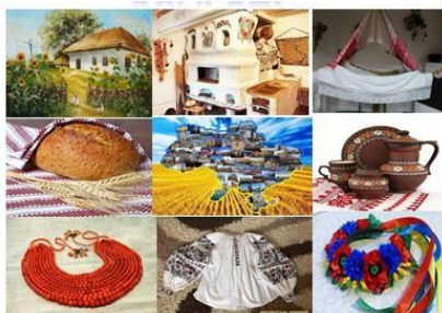
Рис. 1. Кроссенс для визначення теми квесту

Вступна частина заняття починається з привітання, пропонується уявити, що в долонях вихованців є дрібка гарного настрою й поділіться ним, щоб зробити день приємнішим для всіх, хто зараз є поряд; зануритись в унікальну атмосферу автентичної культури українського народу і взяти з собою: К мітливість, В инахідливість, Е нергійність, С таранність, Т ворчість, (перші літери створюють слово «Квест»). Тему пошуку пропонуємо віднайти, розгадуючи кроссенс (Рис. 1).