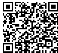
Рис. 2. QR-код.

Назву наступної локації дізнаєтеся, відсканувавши QR-код (Рис 2.). Так ви знайшли назву другої локації.