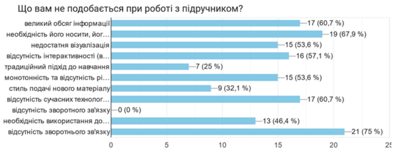
Рис. 1 Результати відповідей на запитання «Що вам не подобається при роботі з підручником?»

підвищення інтересу до навчання та до нової інформації під час використання підручника. Можливі відповіді здобувачів освіти з варіантами «Ні» та «Частково» викликали інтерес до глибшого аналізу. Це підштовхнуло нас до того, щоб сформулювати наступне запитання: «Що вам не подобається при роботі з підручником?». Відповіді на це запитання мали виявити основні недоліки використання традиційних підручників та дозволили зрозуміти, які аспекти роботи з підручником викликають найбільші труднощі у здобувачів освіти.